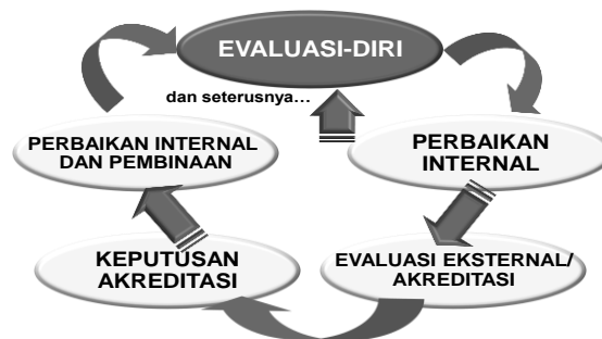
Bagan 1. Daur Penjaminan Mutu dalam Rangka Akreditasi

Seperti dikemukakan terdahulu, evaluasi-diri merupakan salah satu aspek penting dalam keseluruhan daur akreditasi dengan berbagai peran dan kegunaannya, termasuk penjaminan mutu ( quality assurance ). Keseluruhan daur penjaminan mutu dalam rangka akreditasi program studi/ perguruan tinggi itu dilukiskan dalam Bagan 1.